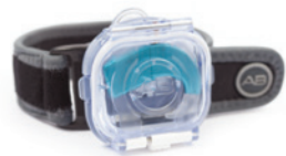
Зажим и нарукавная повязка 1 для самых экстремальных условий