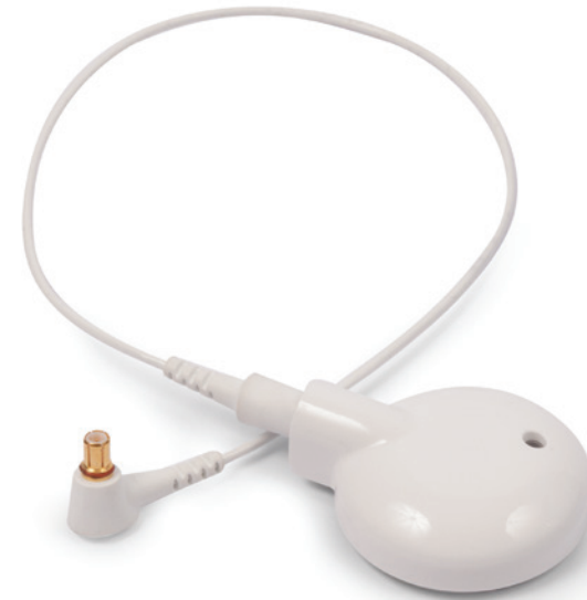
Головной передатчик AquaMic, подсоединенный к кабелю AquaMic

Только головной передатчик AquaMic оснащен водонепроницаемым микрофоном, который не требует защиты и обеспечивает беспрепятственное звуковое восприятие как в воде, так и вне контакта с водой. Он выпускается с кабелями разной длины и разными цветными колпачками и совместим с речевыми процессорами как марки Naída CI, так и марки Neptune™.