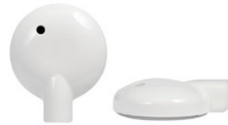
Головной передатчик AquaMic™