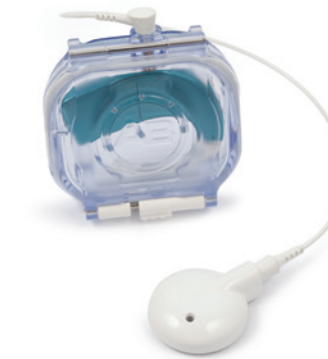
Бокс AquaCase™ для речевого процессора Naída CI