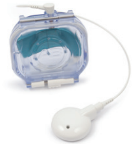
Бокс AquaCase™ для речевого процессора Naída CI

Бокс AquaCase — первый и единственный в мире водонепроницаемый аксессуар для процессора, рассчитанный на неограниченный срок использования