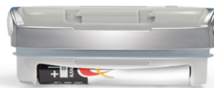
Neptune с одноразовым элементом питания AAA