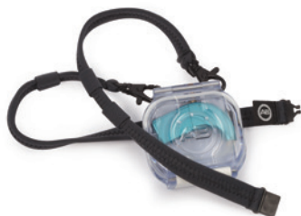
Шейный шнурок для удобства ношения без привлечения внимания