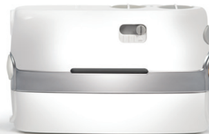
Конфигурация Neptune Connect