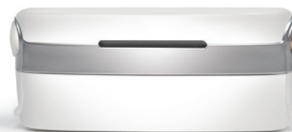
Конфигурация Neptune для плавания