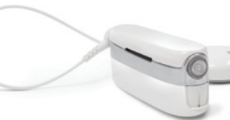
Речевой процессор Neptune™

Вы хотите поплавать в бассейне или нырнуть в океан, сохраняя способность слышать четко? Или, может быть, вы хотите, чтобы ваш ребенок так же, как и любой другой малыш, мог в полной мере наслаждаться каким угодно активным отдыхом в какой угодно обстановке? Независимо от характера занятия, а также от того, встретятся ли на пути вода, пот, грязь и пыль, разработанные АВ технологии обеспечения полной водонепроницаемости дают уникальные преимущества в любой ситуации.